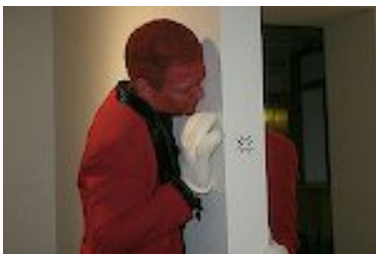
Performance, Humobisten, 2005