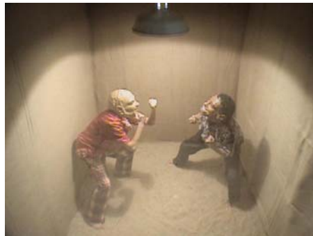
Cock Fight , Katia Bassanini, 2004